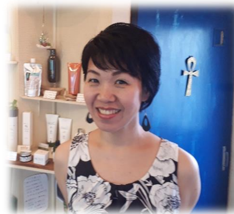
メンテナンスサロン サンサーラ Y a y o i 先生